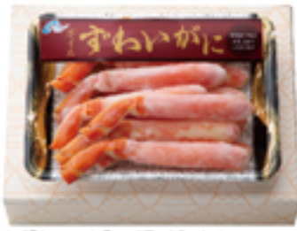
ずわいがに足ポイル ポーション (500g前後)