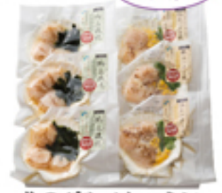
北のグルメキッチン 帆立2種セット (すべて加熱用)